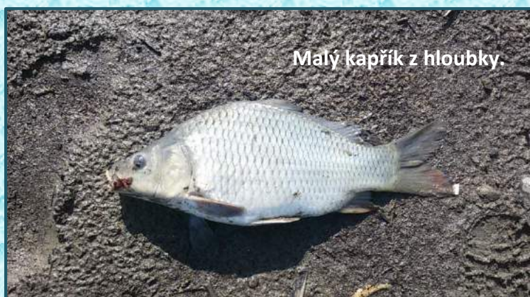
Malý kapřík z hloubky.