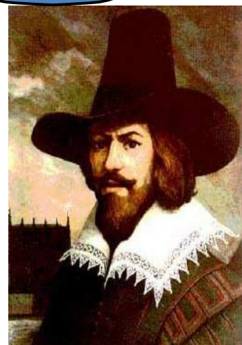
Atentátník Guy Fawkes