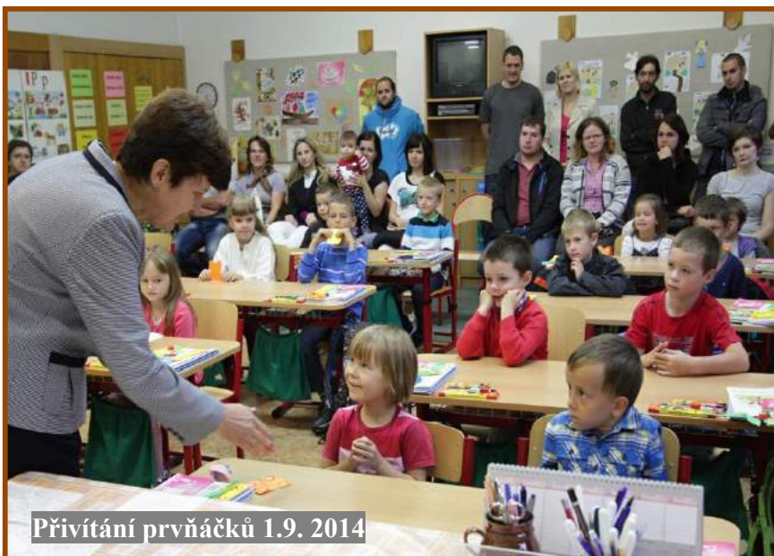
Přivítání prvňáčků 1.9. 2014