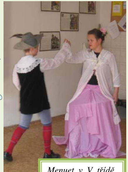
Menuet v V. třídě